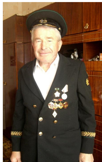
Интервью с учащимися 10 «А» класса Сосенской средней школы № 2