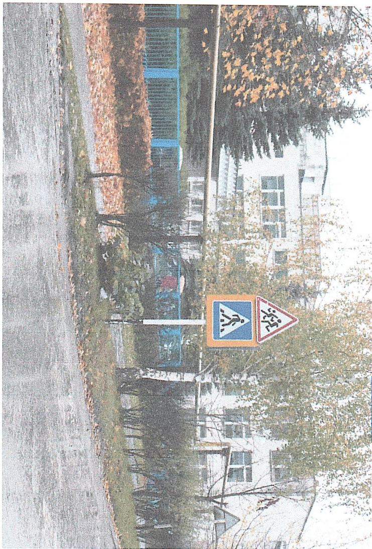
Фото на странице: 0